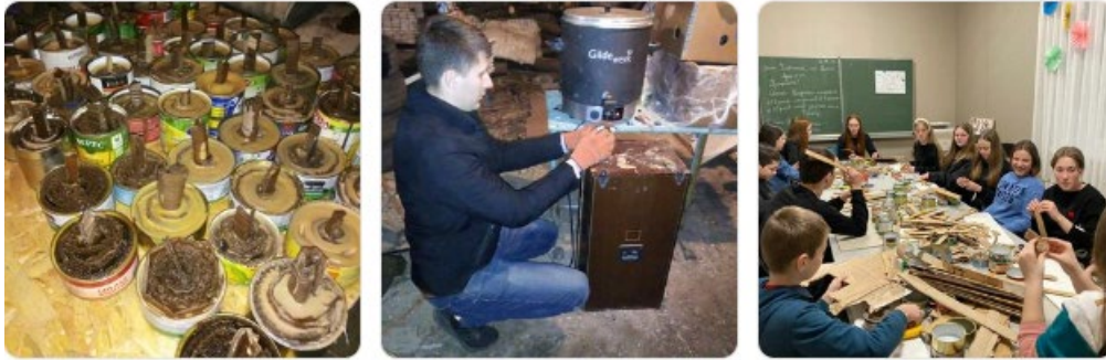
Opération bougies (930kg récoltés)