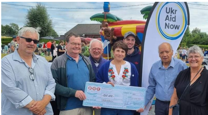
Soutien de la Pac de Herve