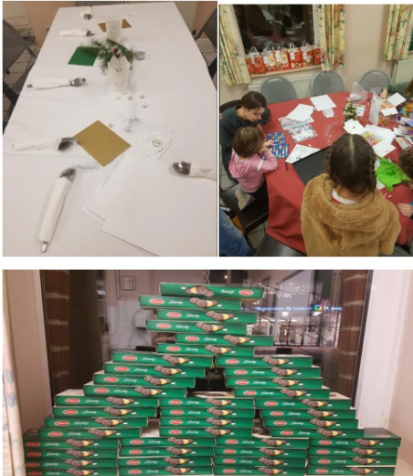
Souper festif du 30 décembre avec les familles ukrainiennes