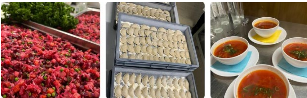
Repas organisé par les Ukrainiens d'Eupen en faveur de l'Asbl avec le soutien de la Brasserie Peiffer de Baelen