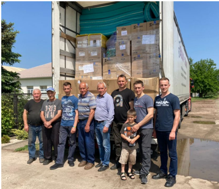
Convoi de mai 2023 dont 30 matelas bien arrivés.