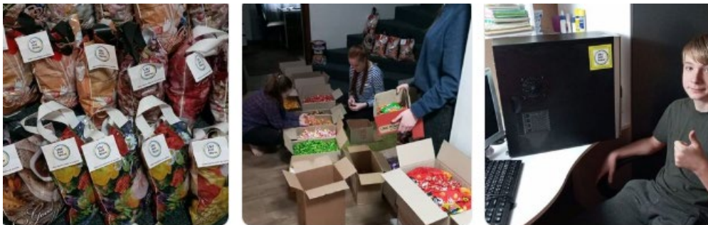
Dons pour les enfants décembre 22