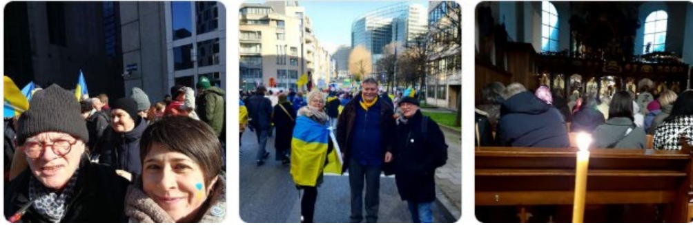
Commémoration et manifestation de soutien en février 23